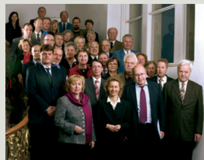
Repräsentanten von mehr als 20 Verbänden trafen sich mit Bundesfamilienministerin Ursula von der Leyen zum Auftakt der Bundesregierungsinitiative »Orte der Vielfalt«.

Weitere Informationen gibt es online unter www.orte-der-vielfalt.de . (sda)